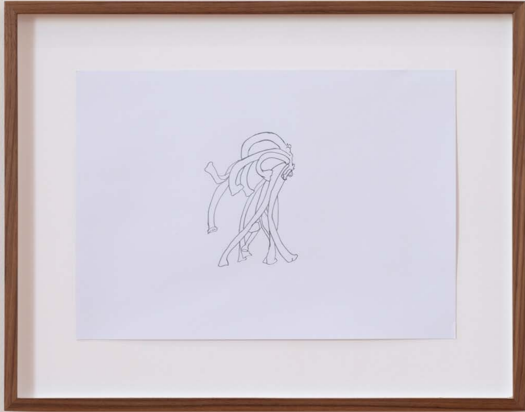
Samtfußrübling und Salbei , 2023, Exhibition view: Exhibit Galerie, Academy of fine Arts Vienna