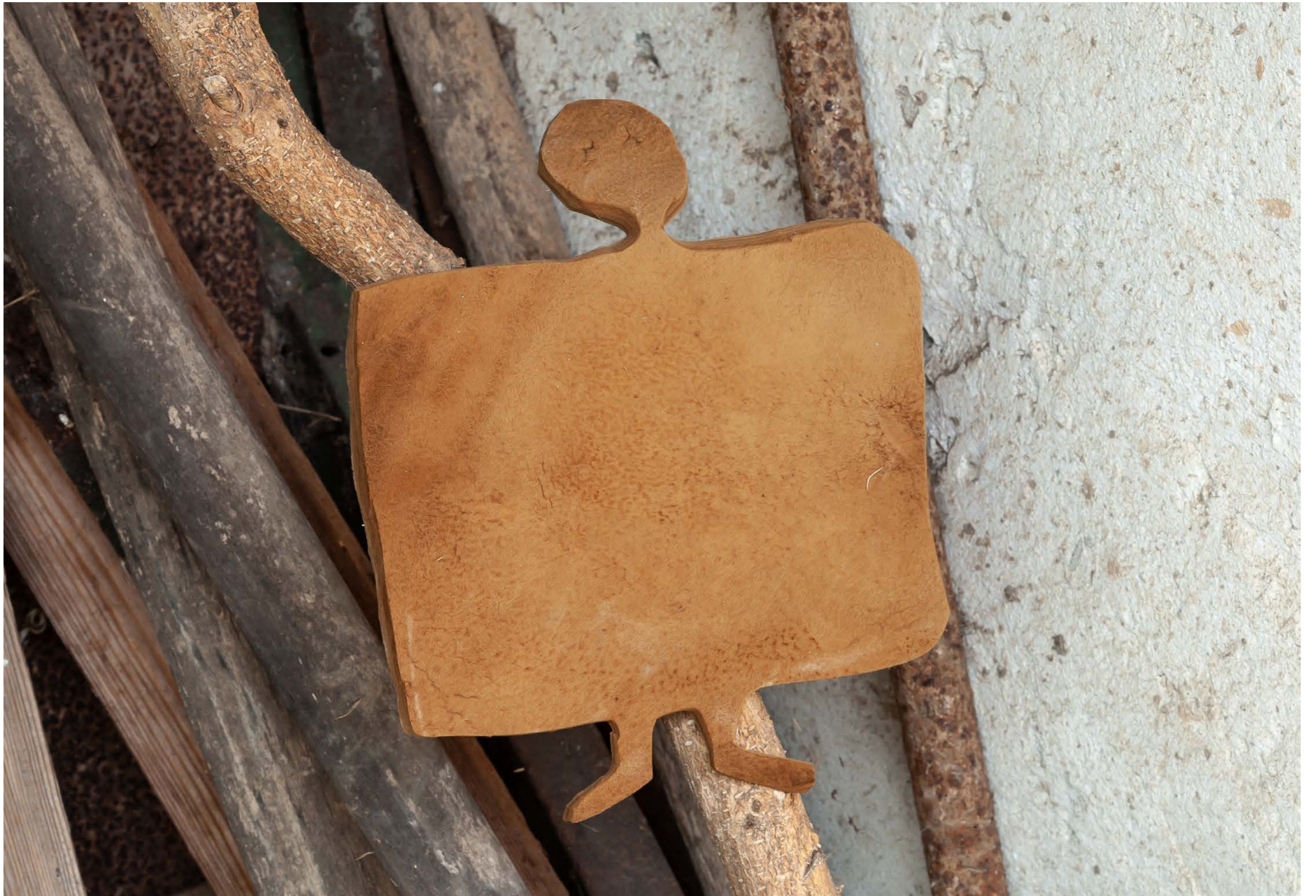
Woolgathering shepherdesses from the series: Keeping up with the Kurds , 2024, Exhibition view: Baba Vasa`s Cellar, Photo: Flavio Palasciano