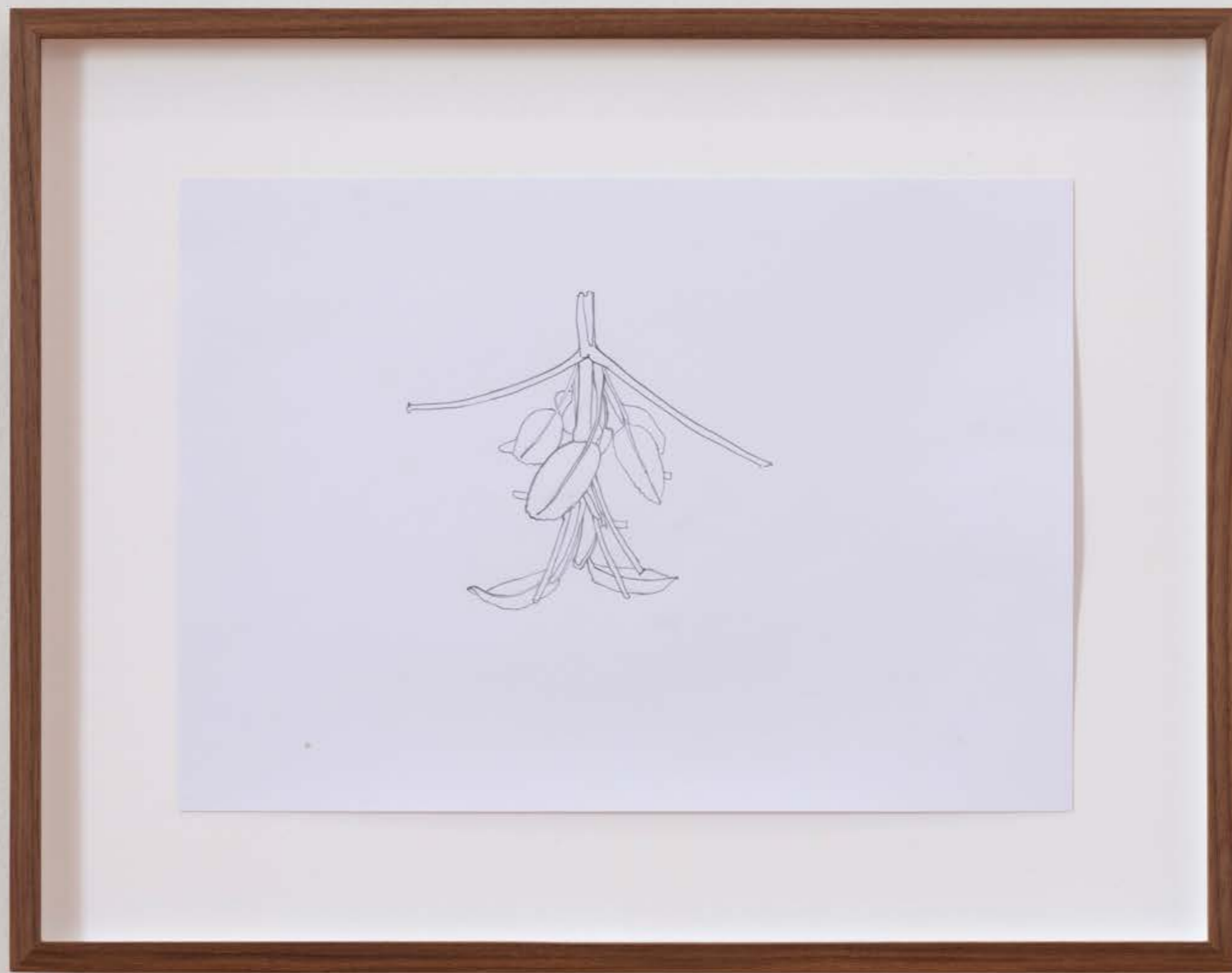
Samtfußrübling und Salbei , 2023, Exhibition view: Exhibit Galerie, Academy of fine Arts Vienna, Photo: Sophie Pölzl