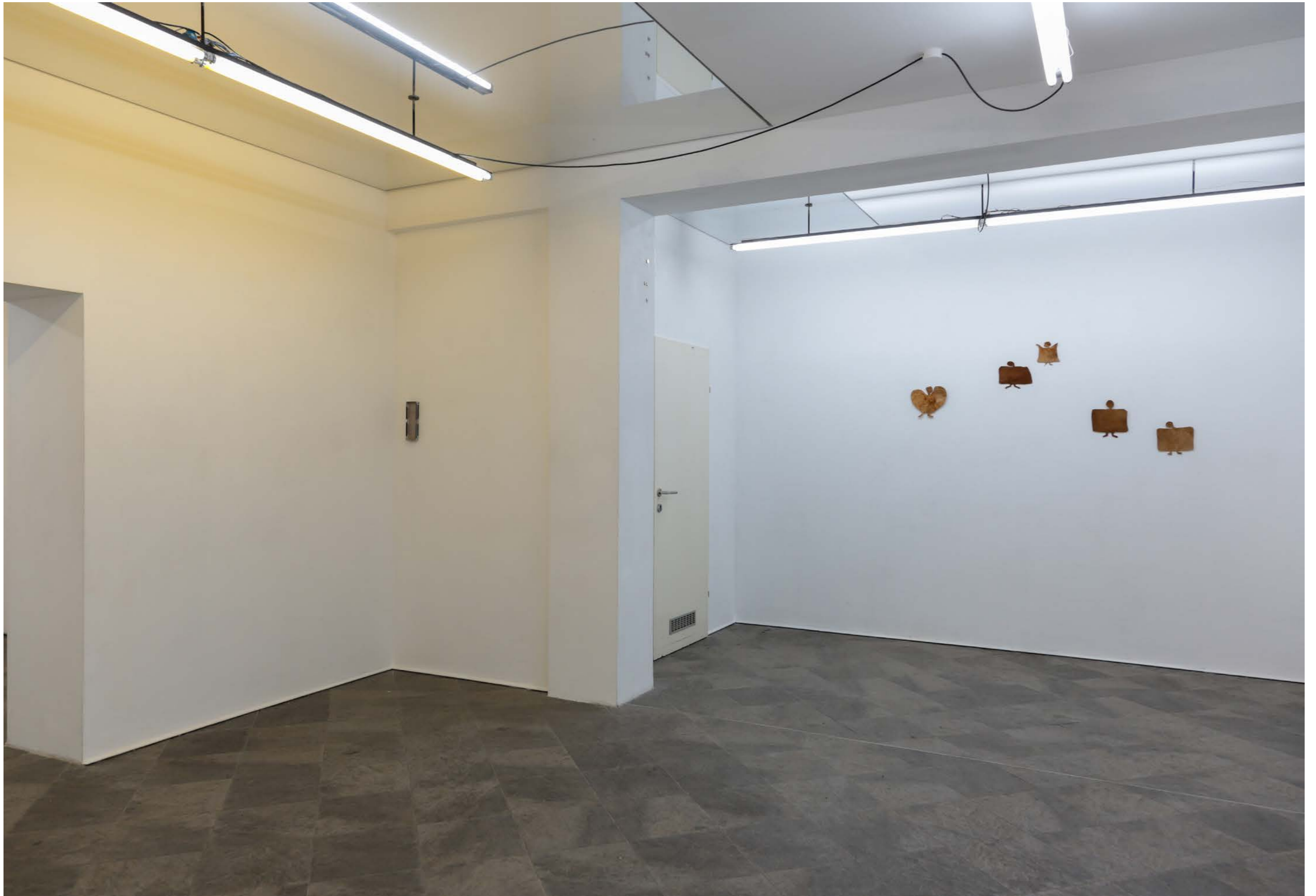
Woolgathering shepherdesses from the series: Keeping up with the Kurds , 2024, Exhibition view: Ve.sch Kunstverein, Photo: Aaron Amar Bhamra