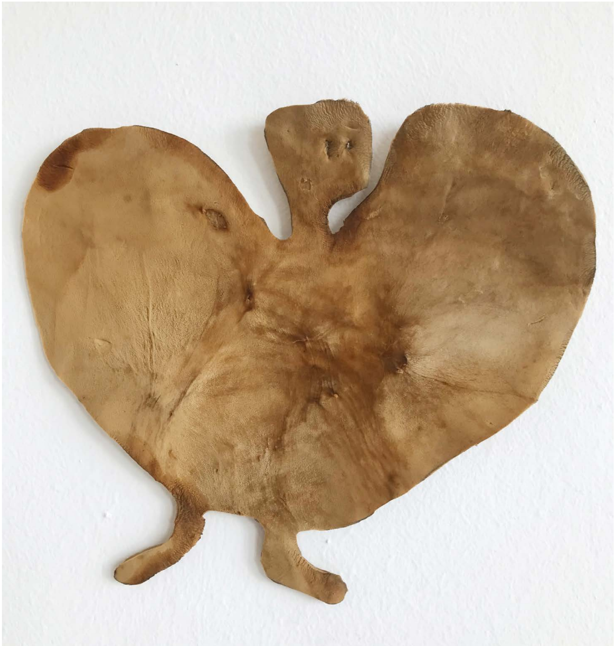
Woolgathering shepherdesses from the series: Keeping up with the Kurds , 2024, Exhibition view: Ve.sch Kunstverein