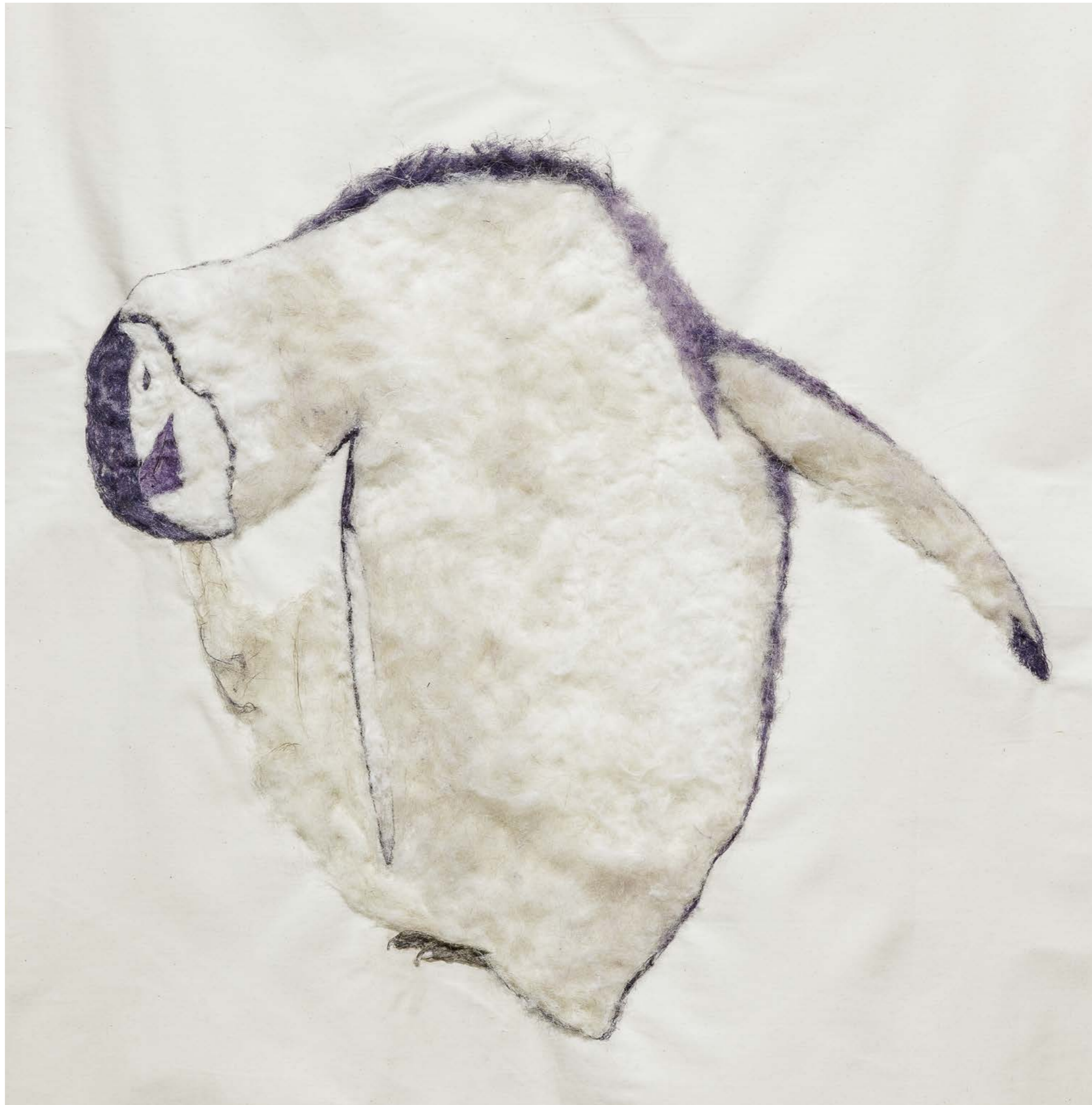
Itchy & Scratchy , 2022, 4 Paintings on nettle cloth (Detail penguin), Exhibition view: Kunsthalle Vienna 2022