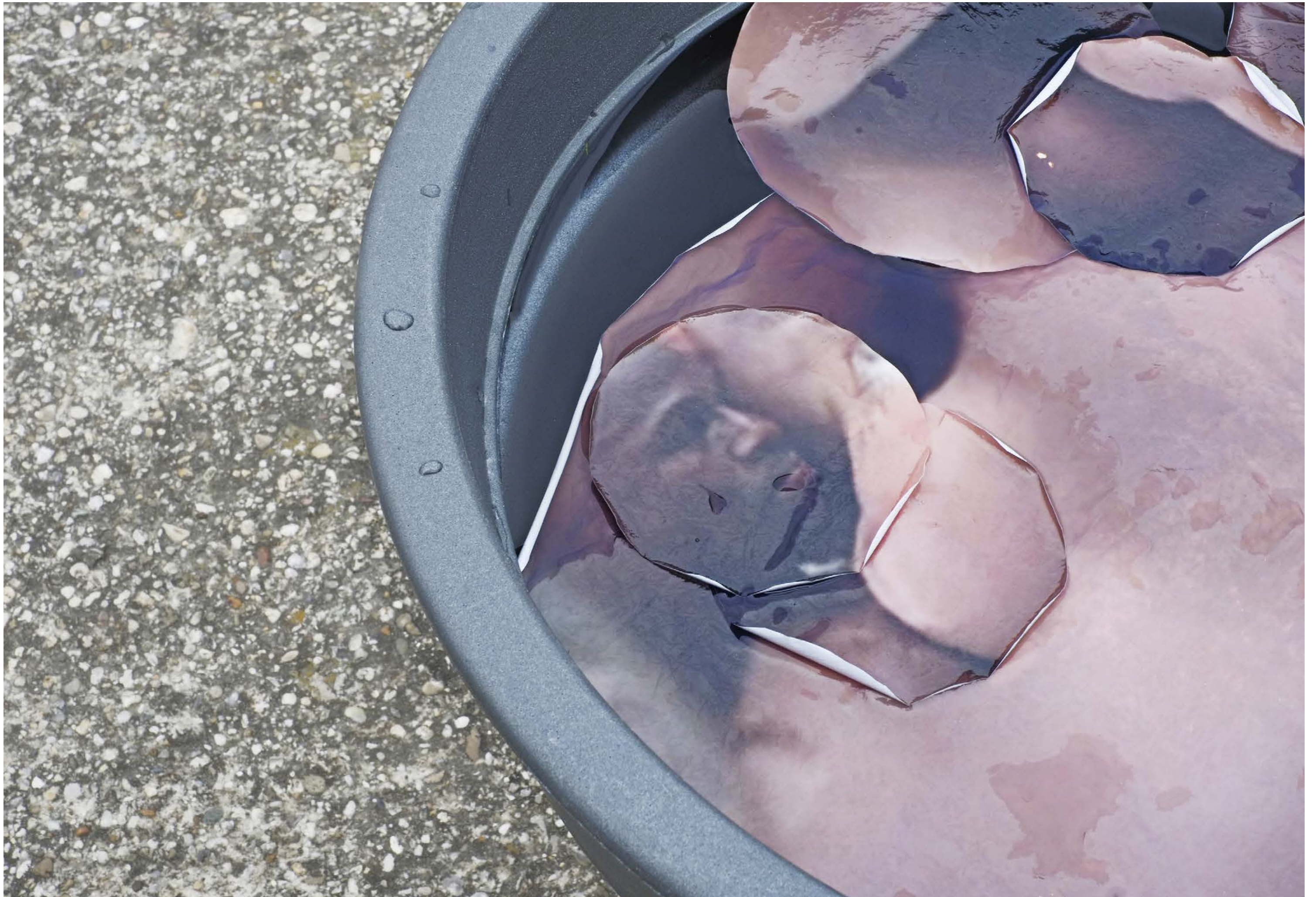
Conquest of Paradise , 2017, plant pots, water, peeled photographs, Exhibition view: Mirage 2 , Donauinsel