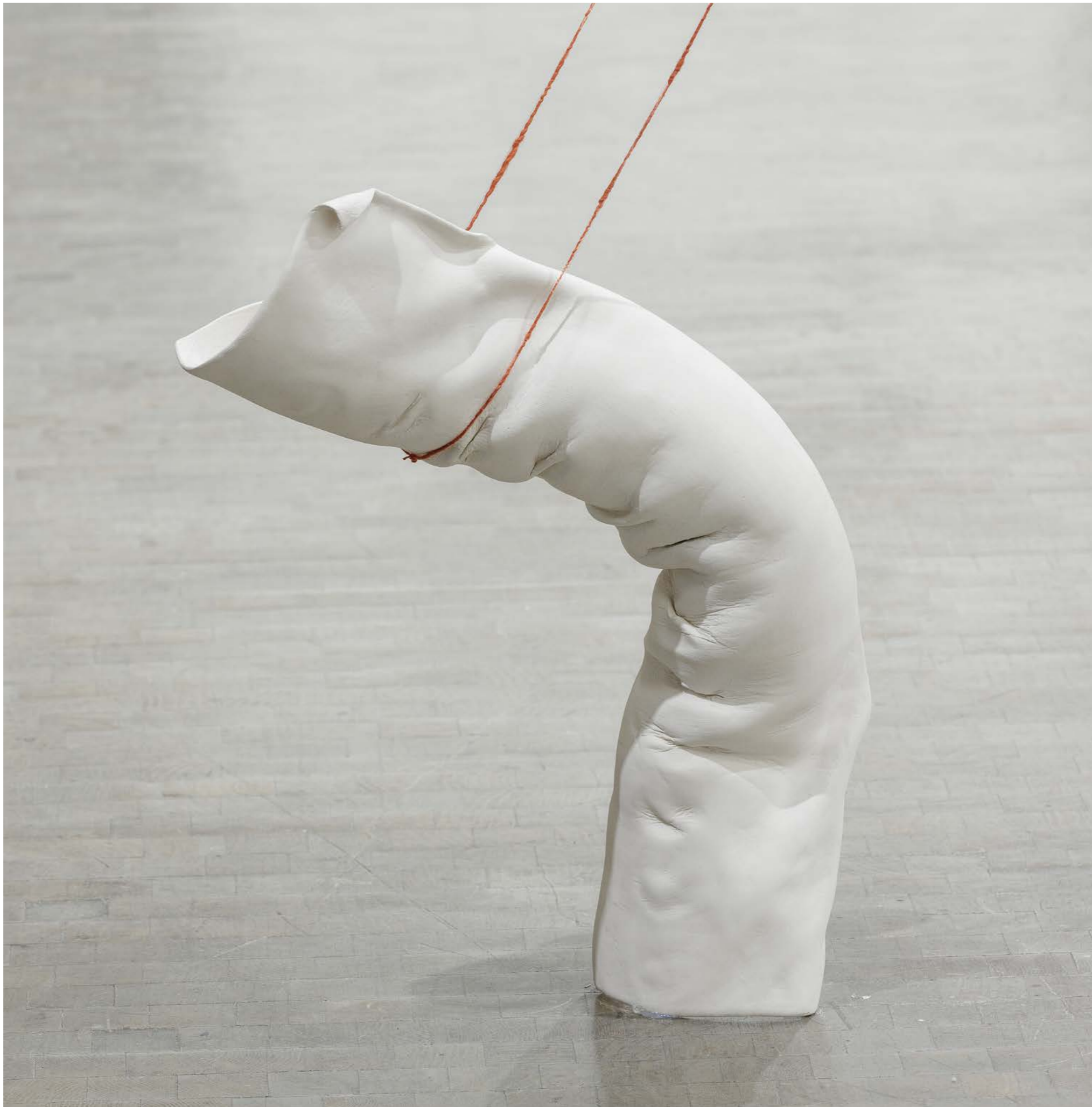
Schulen über der Erde (Airs above ground) 2022, Ceramic and Threads, (Detail of one Sculptures out of 9), Exhibition view: Kunsthalle Wien 2022, Photo: kunstdokumentation