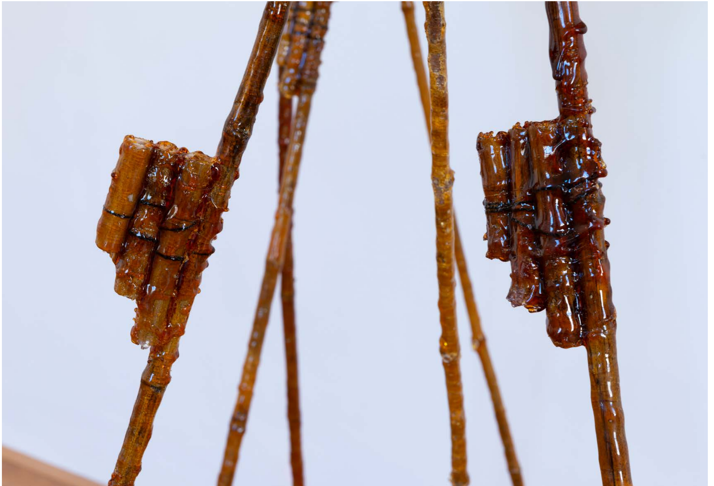
Los zancos , 2023, from the series: Keeping up with the Kurds , exhibition view: Recasted Relations, Exhibit Galerie, Academy of fine Arts Vienna, Photo: Sophie Pözl