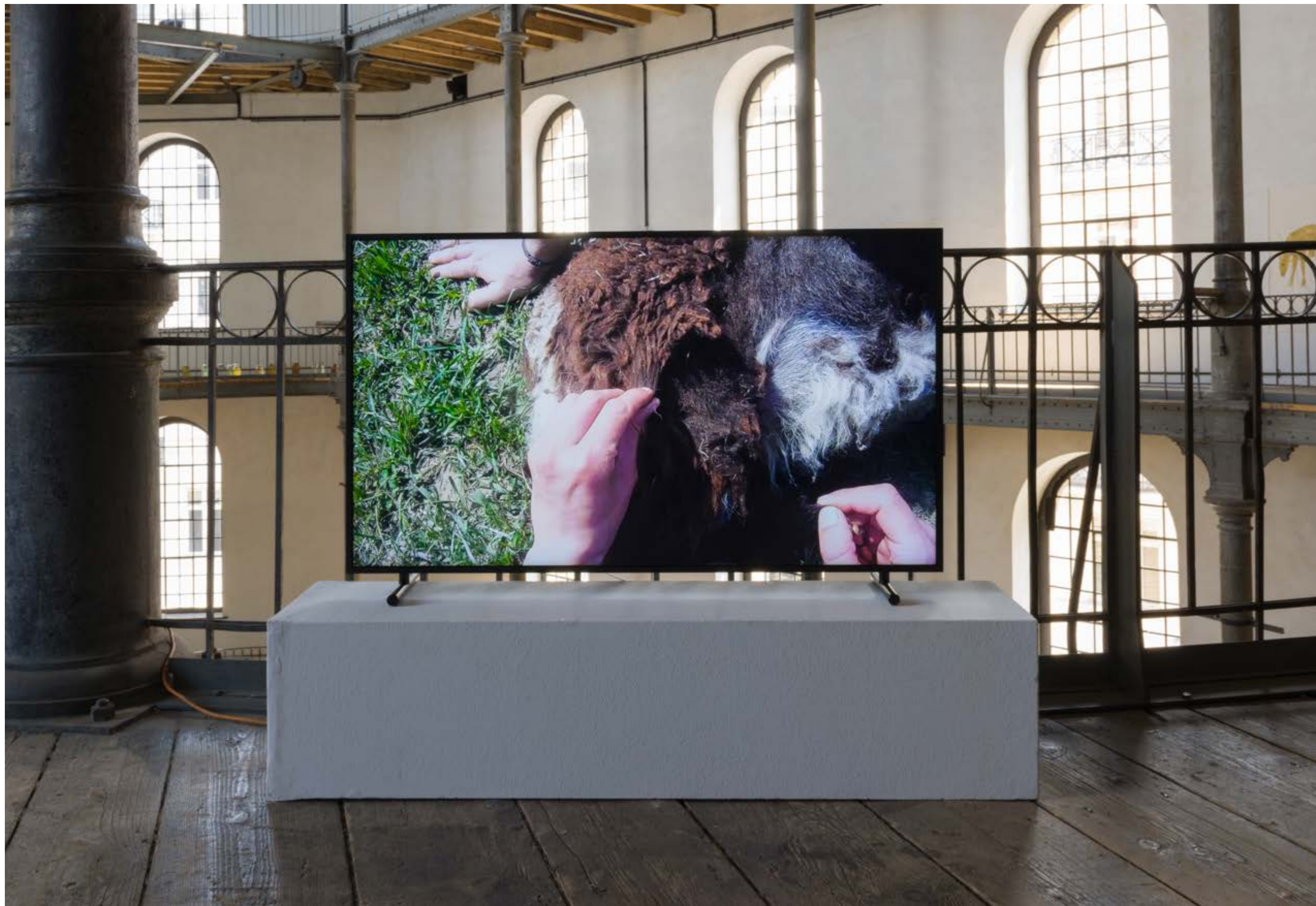
Spinning Jenny , 2021, Video (Filmstill), Exhibition view: Academy of fine Arts Vienna, Photo: Sophie Pözl