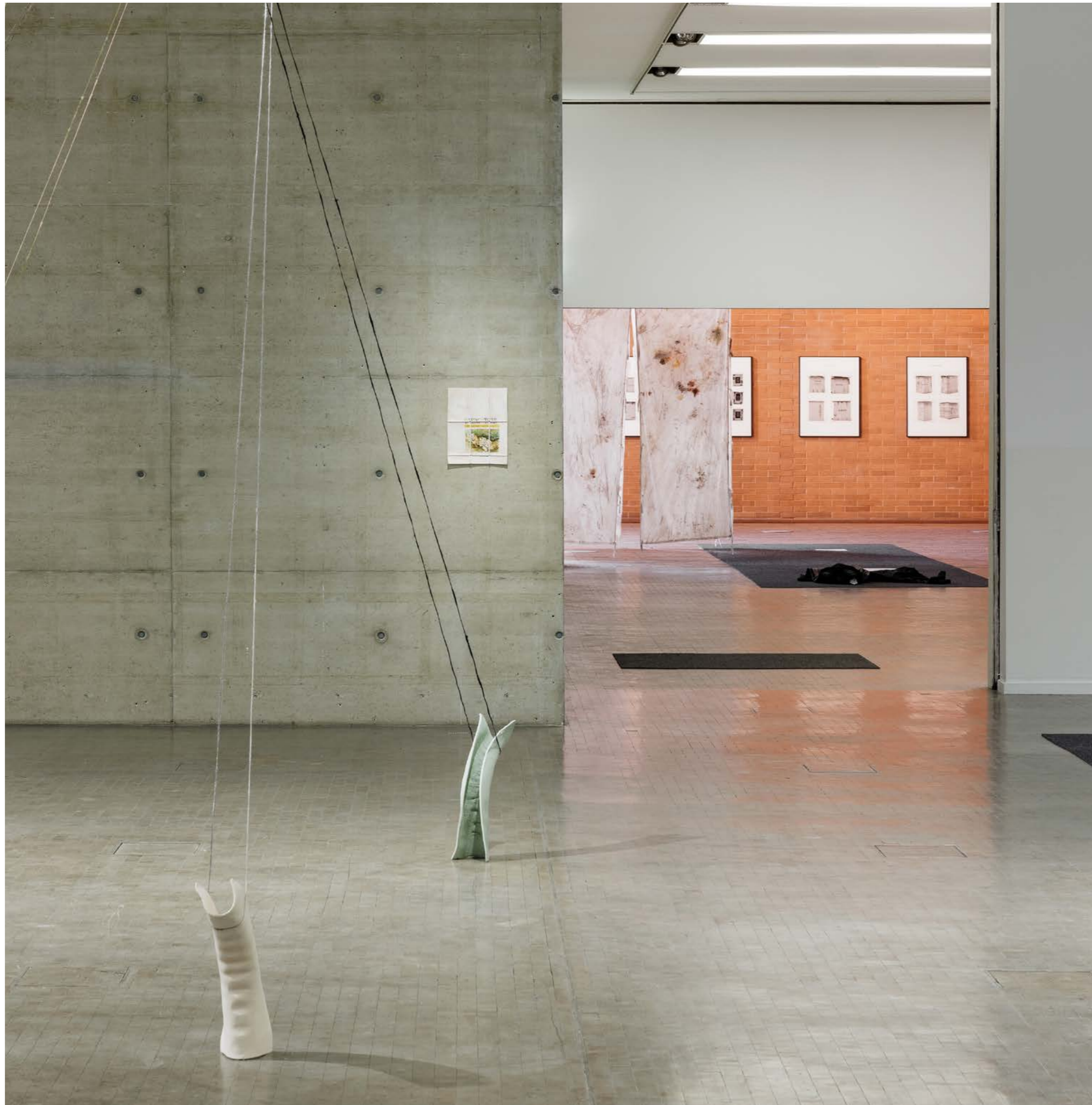
Schulen über der Erde (Airs above ground) 2022, Ceramic and Threads, (Detail of two Sculptures out of 9), Exhibition view: Kunsthalle Wien 2022