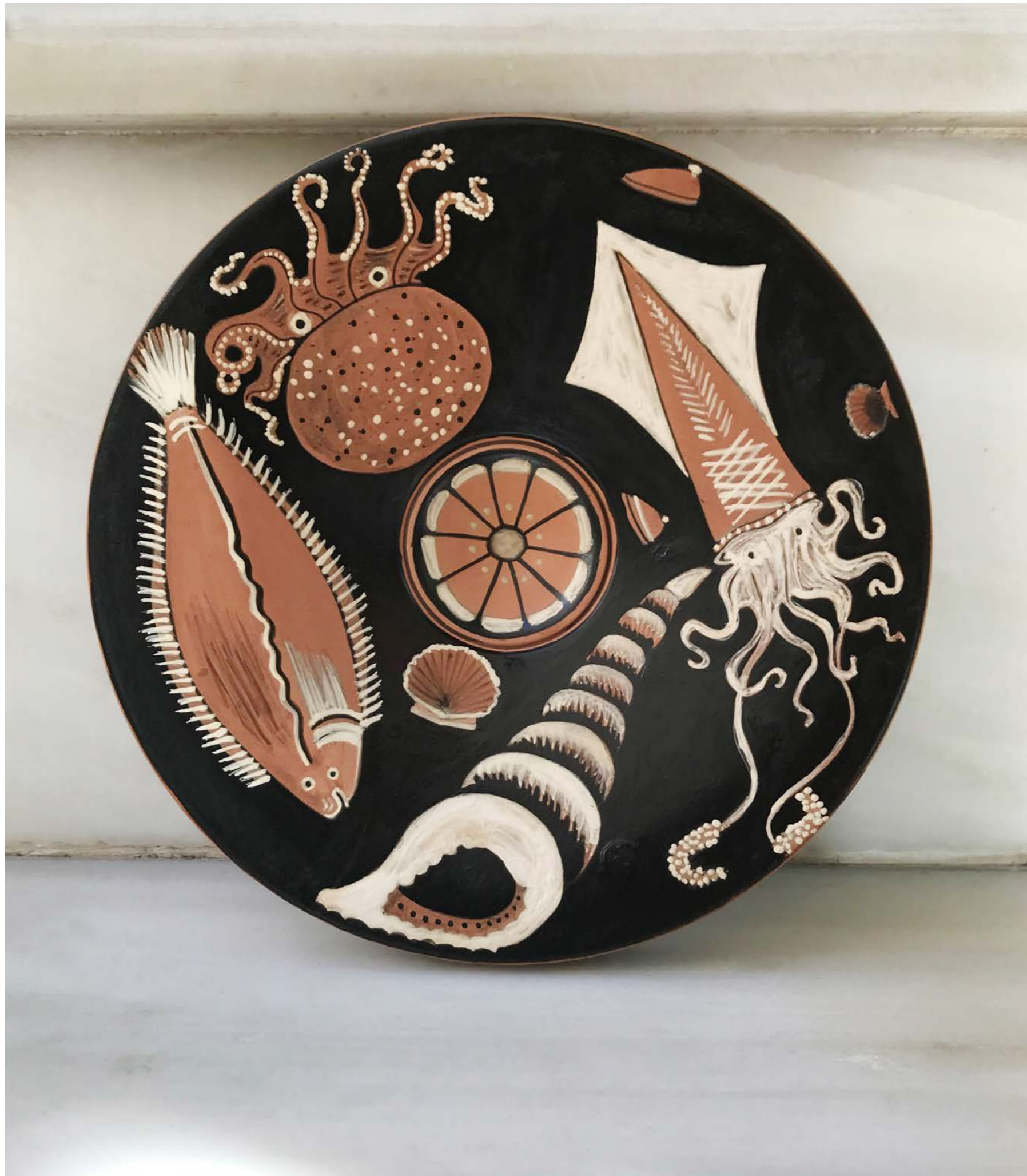
Fish Plates , 2020, ceramic with red-figure painting