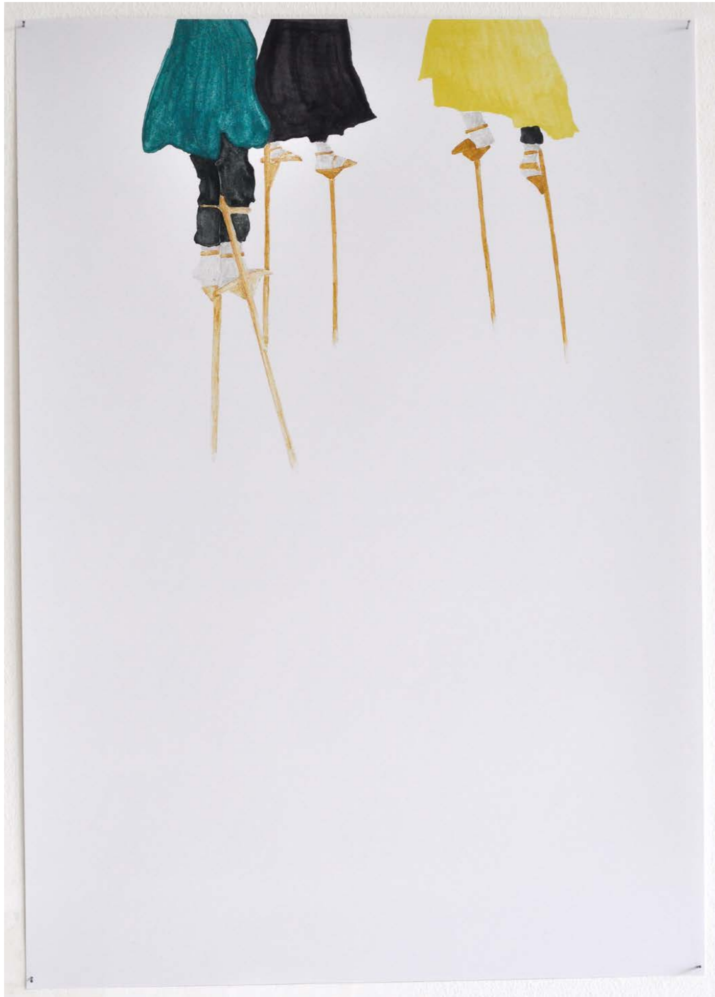
Keeping up with the kurds, 2022, Collage