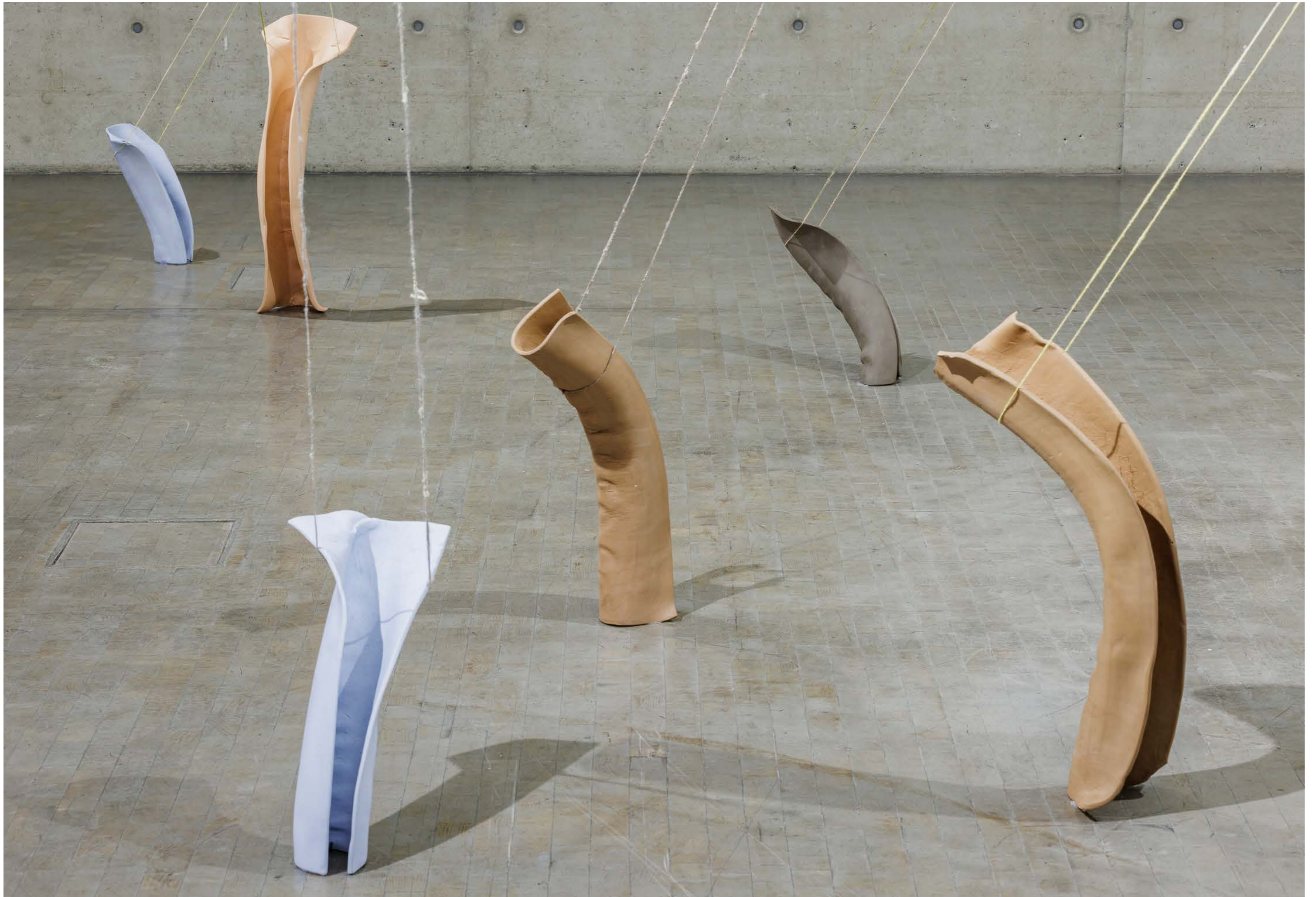
Schulen über der Erde (Airs above ground) 2022, Ceramic and Threads, (Detail of 6 Sculptures out of 9), Exhibition view: Kunsthalle Wien 2022, Photo: kunstdokumentation