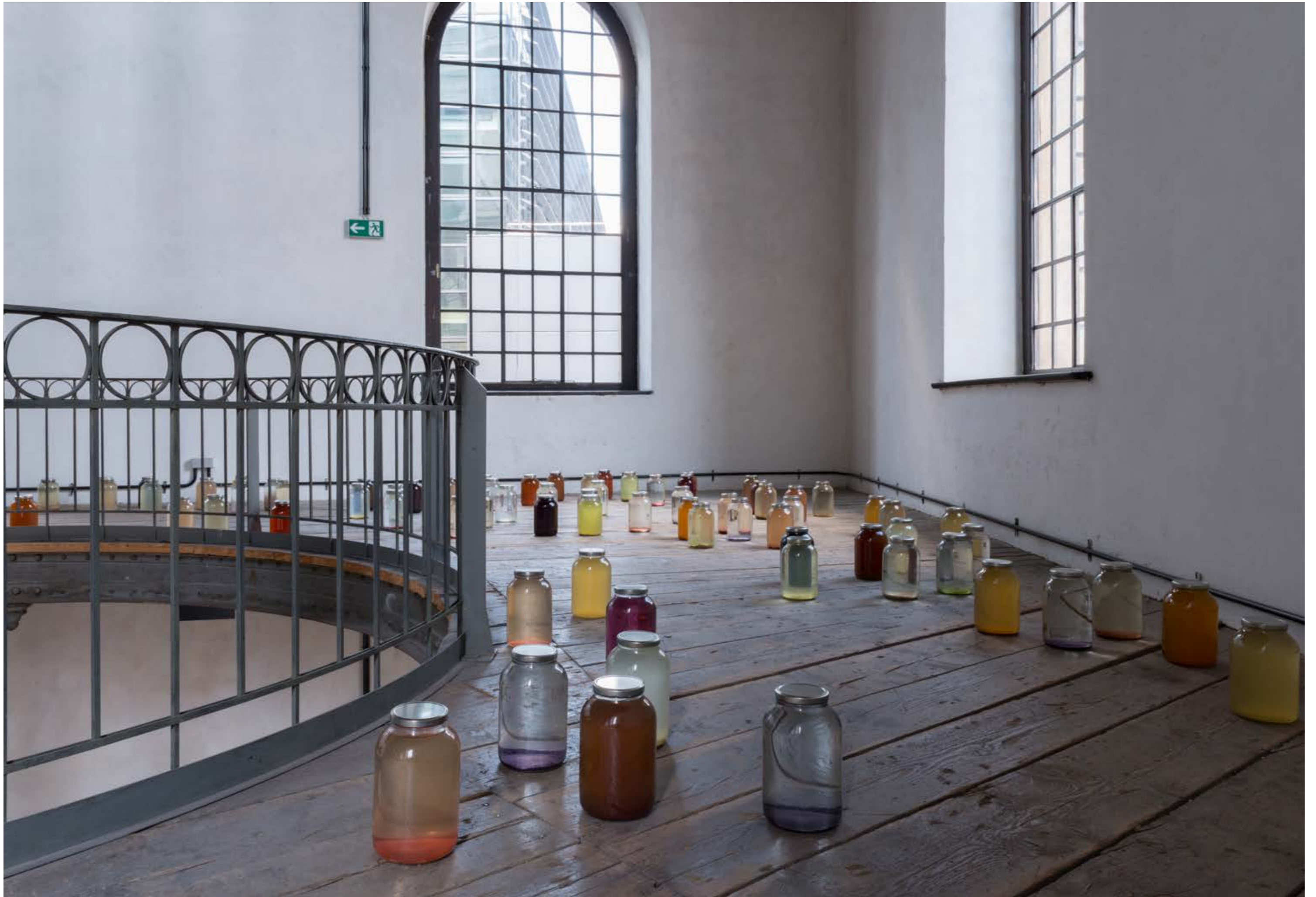
Knock out , 2021, plant colour extracts in preserving jars , Exhibition view: Academy of fine Arts Vienna, Photo: Sophie Pözl