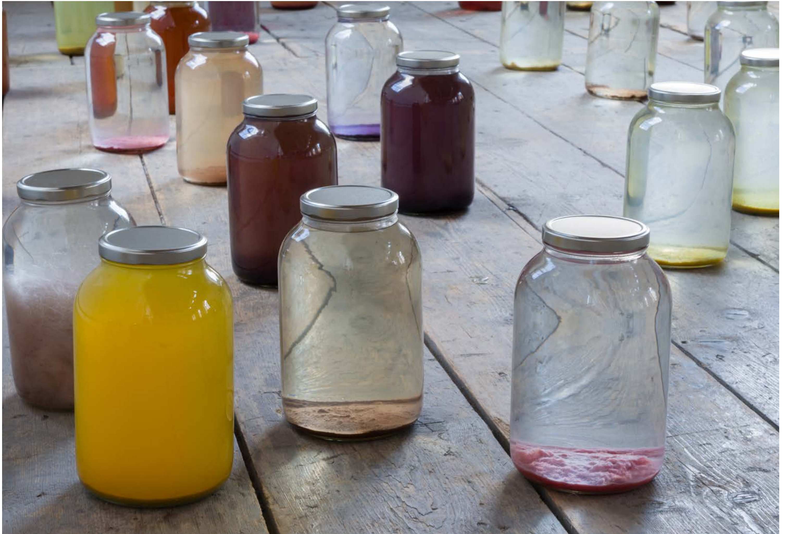
Knock out , 2021, plant colour extracts in preserving jars , Exhibition view: Academy of fine Arts Vienna, Photo: Sophie Pözl