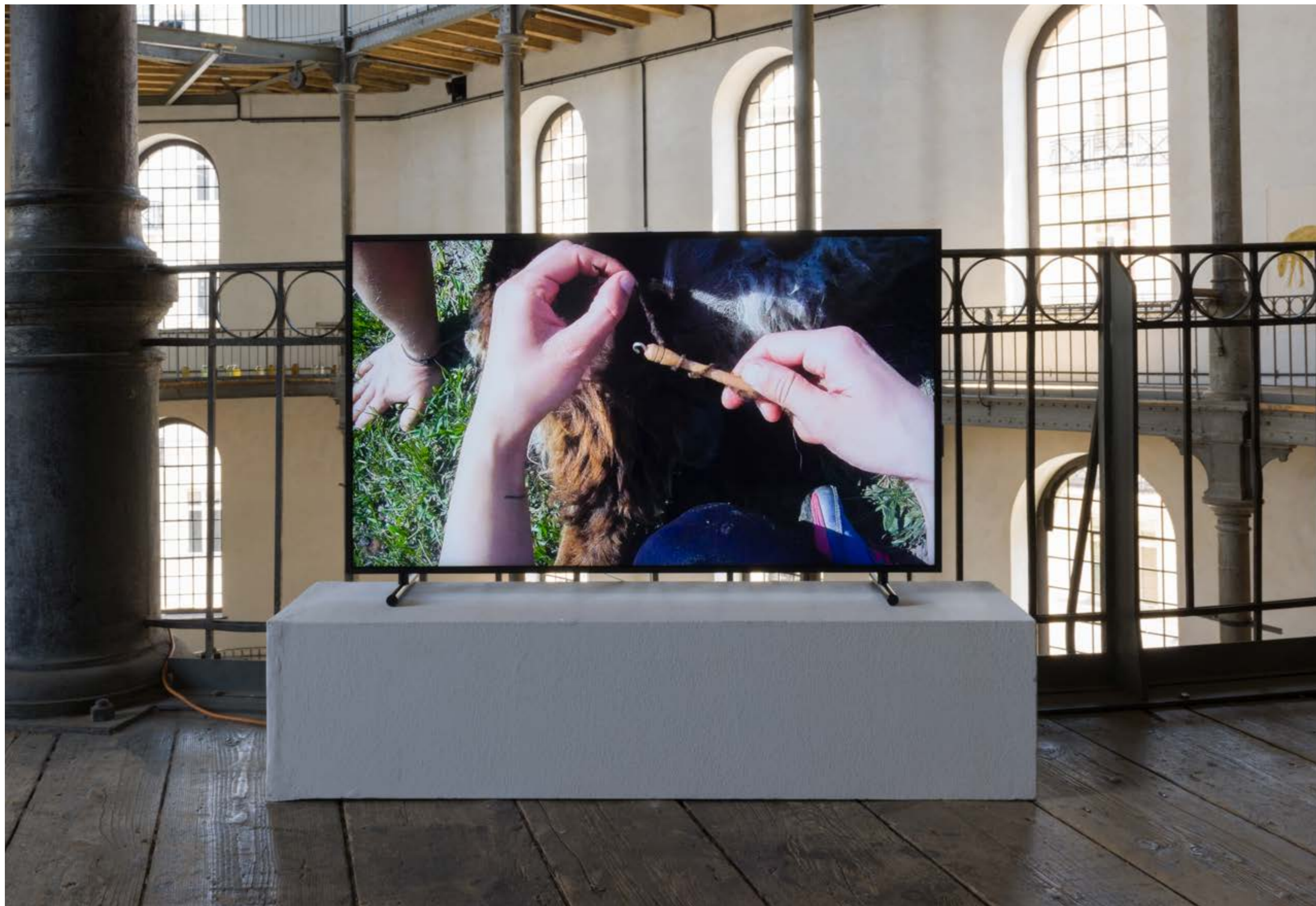
Spinning Jenny , 2021, Video (Filmstill), Exhibition view: Academy of fine Arts Vienna, Photo: Sophie Pözl