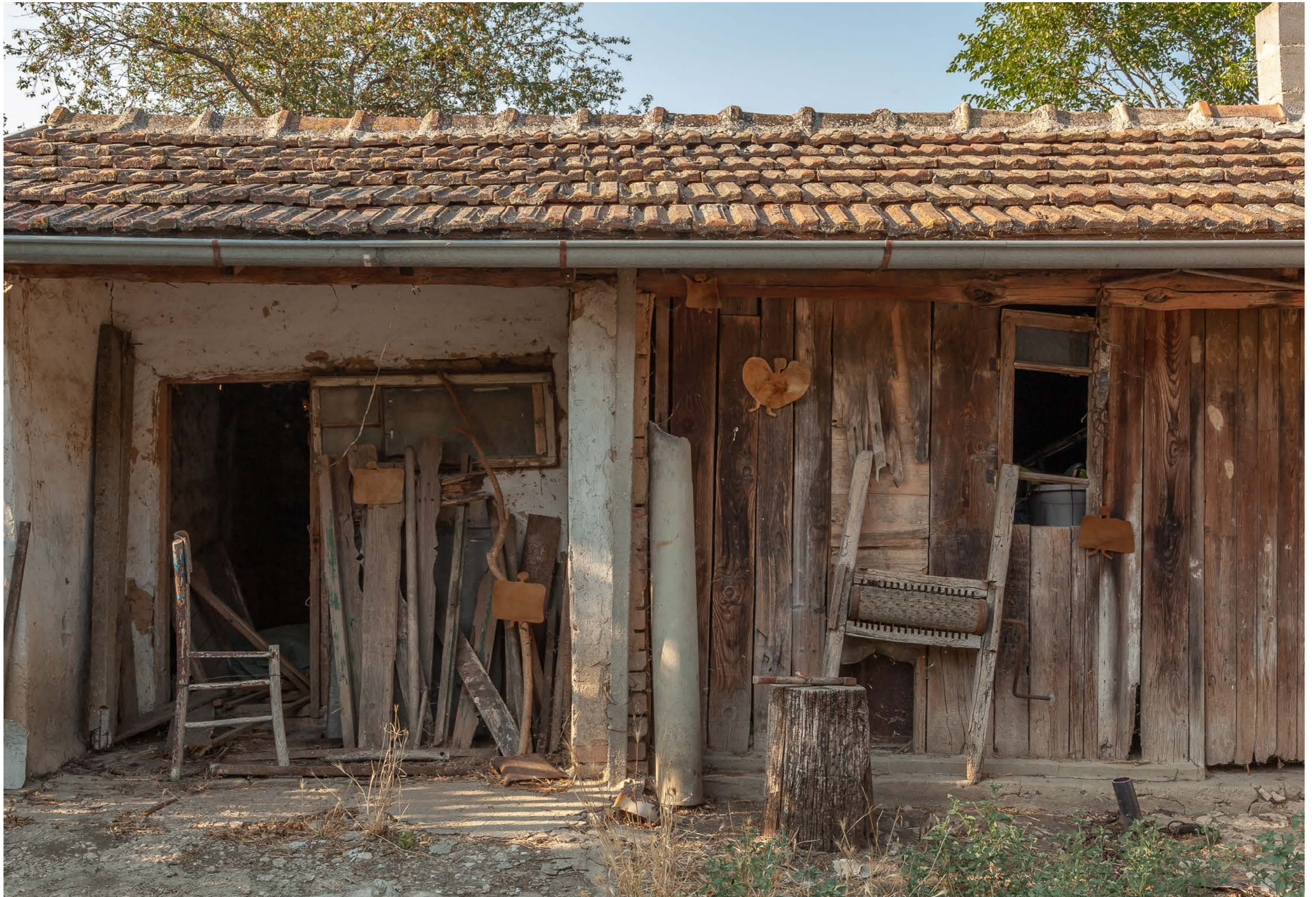
Woolgathering shepherdesses from the series: Keeping up with the Kurds , 2024, Exhibition view: Baba Vasa`s Cellar, Photo: Flavio Palasciano