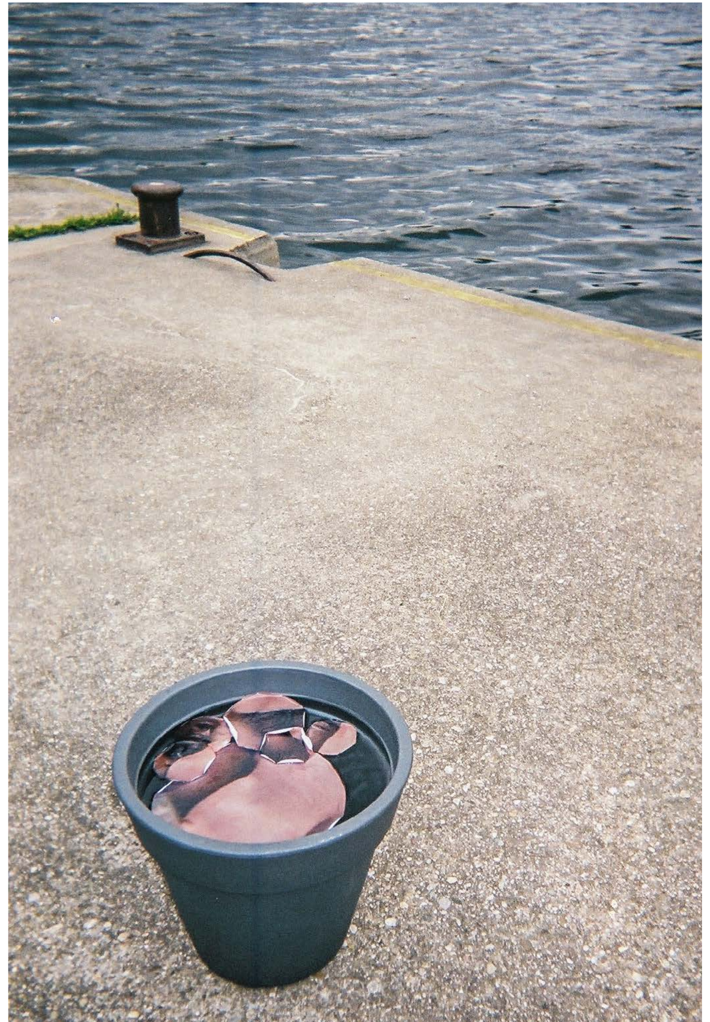
Conquest of Paradise , 2017, plant pots, water, peeled photographs, Exhibition view: Mirage 2, Donauinsel