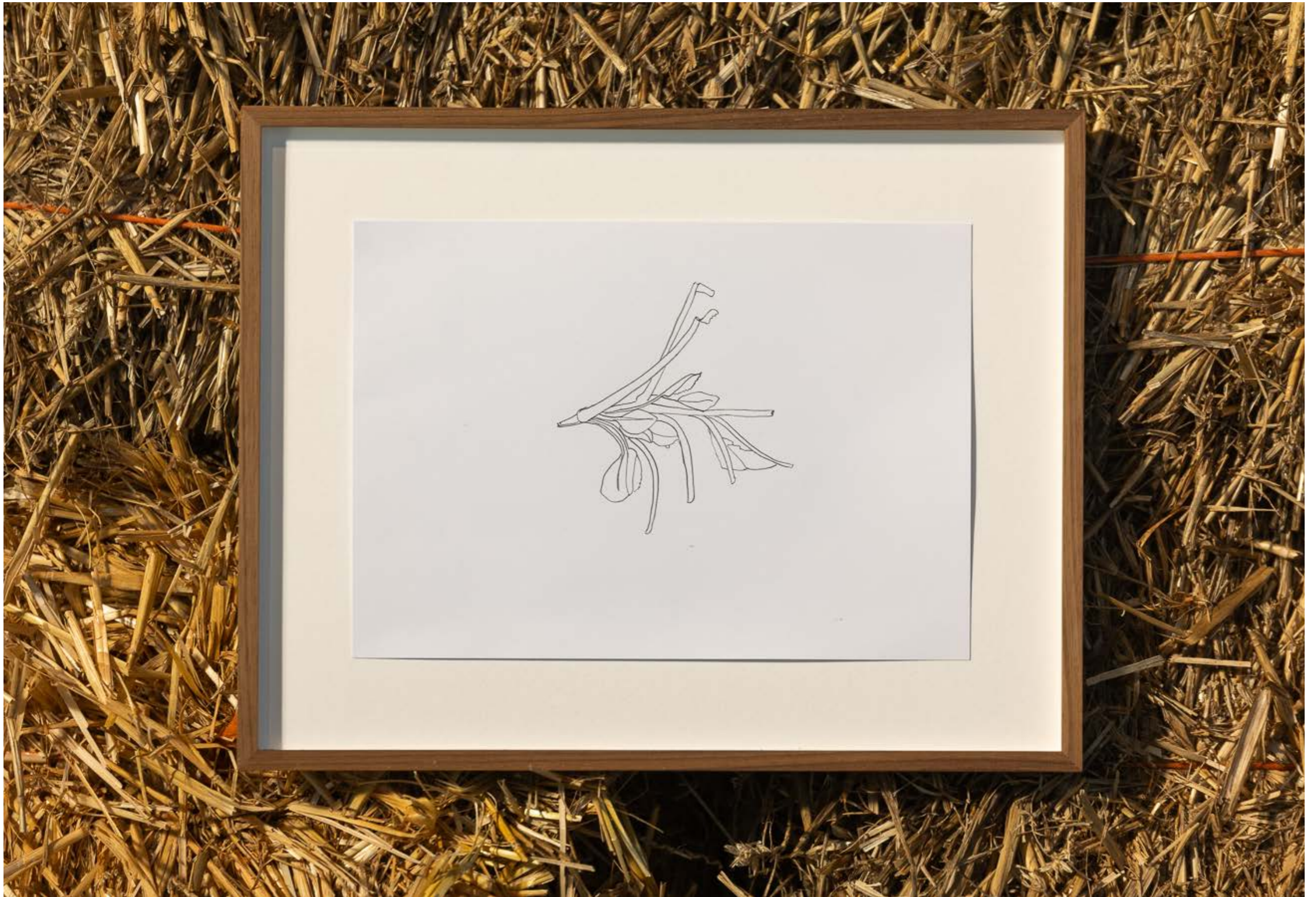
Samtfußrübling und Salbei , 2023, Exhibition view: The one straw revolution curated by iLiana Fokianaki, Framer Framed, Amsterdam 2024.