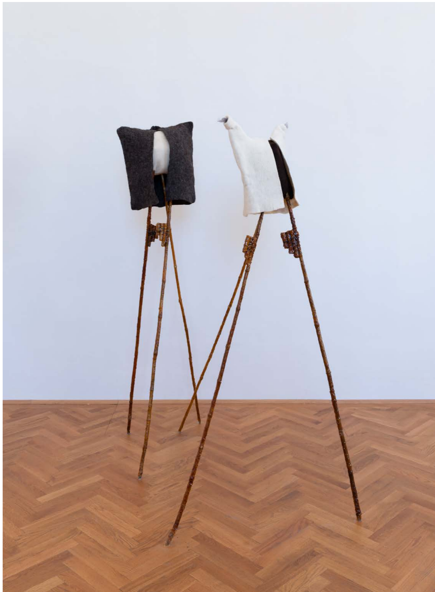
Los zancos , 2023, from the series: Keeping up with the Kurds , exhibition view: Recasted Relations, Exhibit Galerie, Academy of fine Arts Vienna