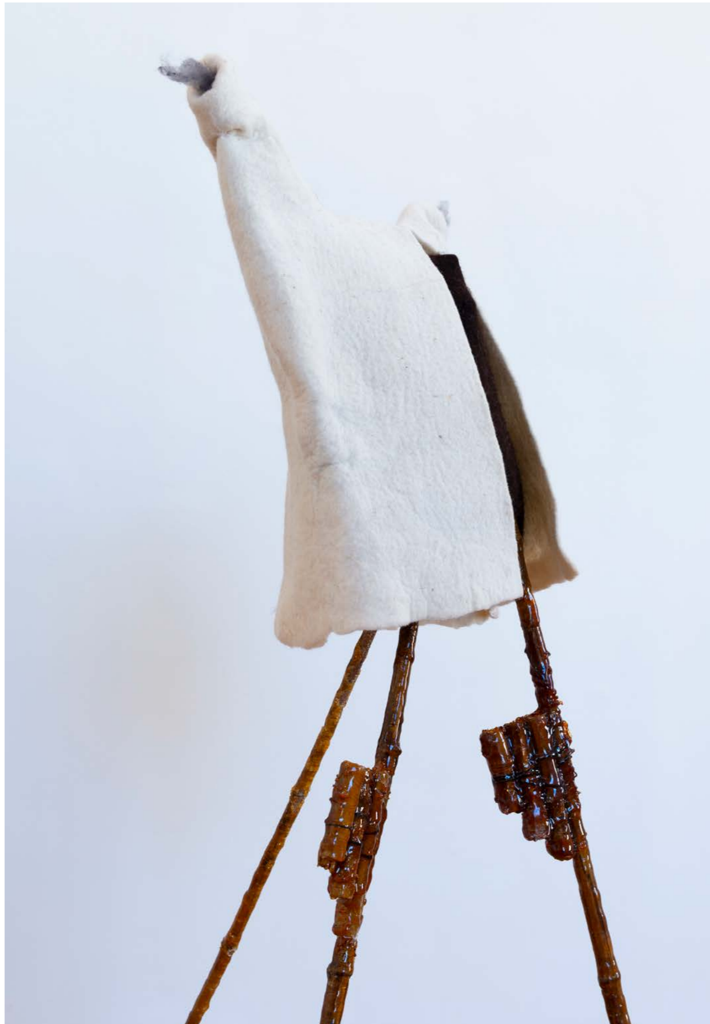
Los zancos , 2023, from the series: Keeping up with the Kurds , exhibition view: Recasted Relations, Exhibit Galerie, Academy of fine Arts Vienna, Photo: Sophie Pözl