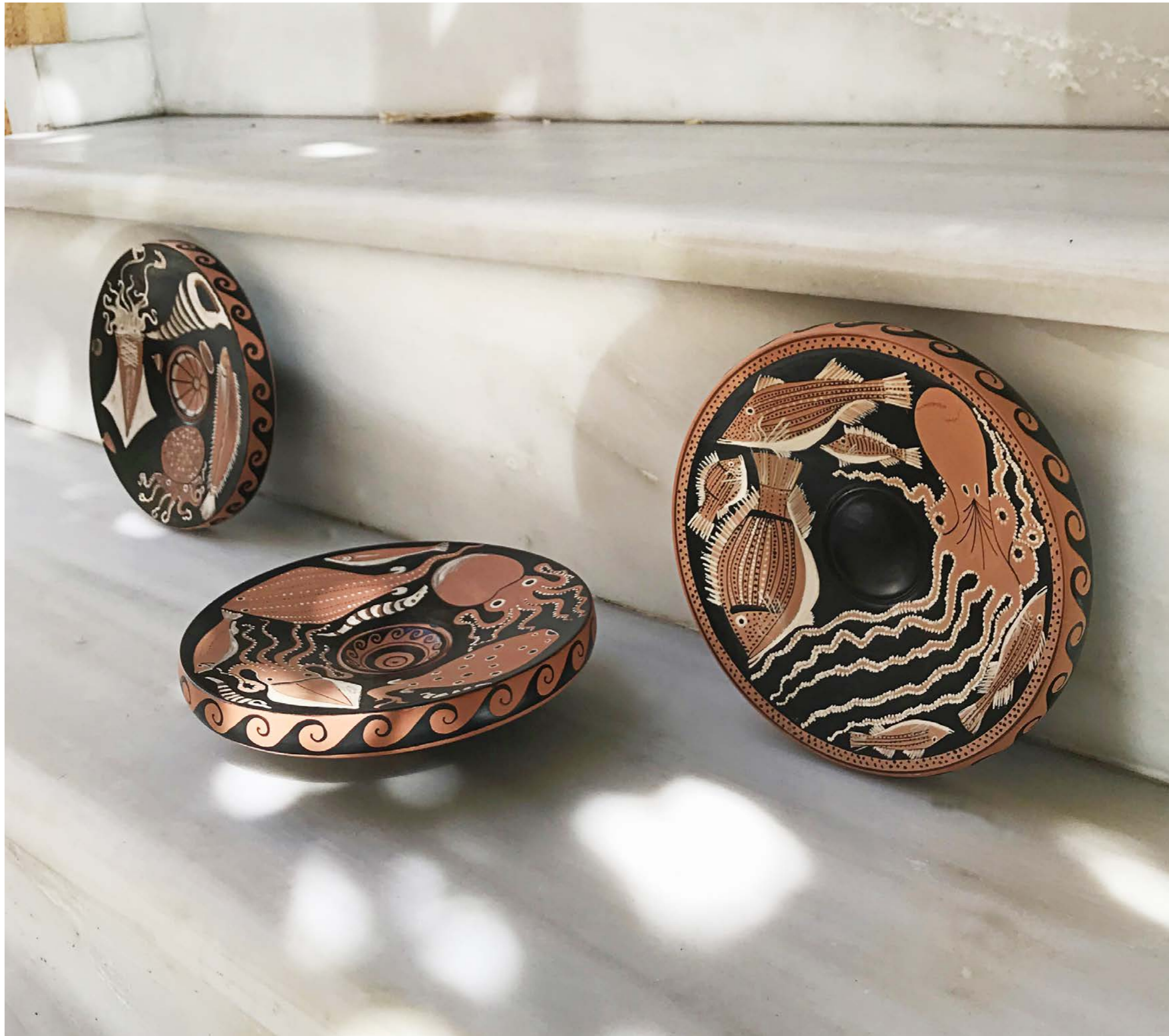
Fish Plates , 2020, ceramic with red-figure painting