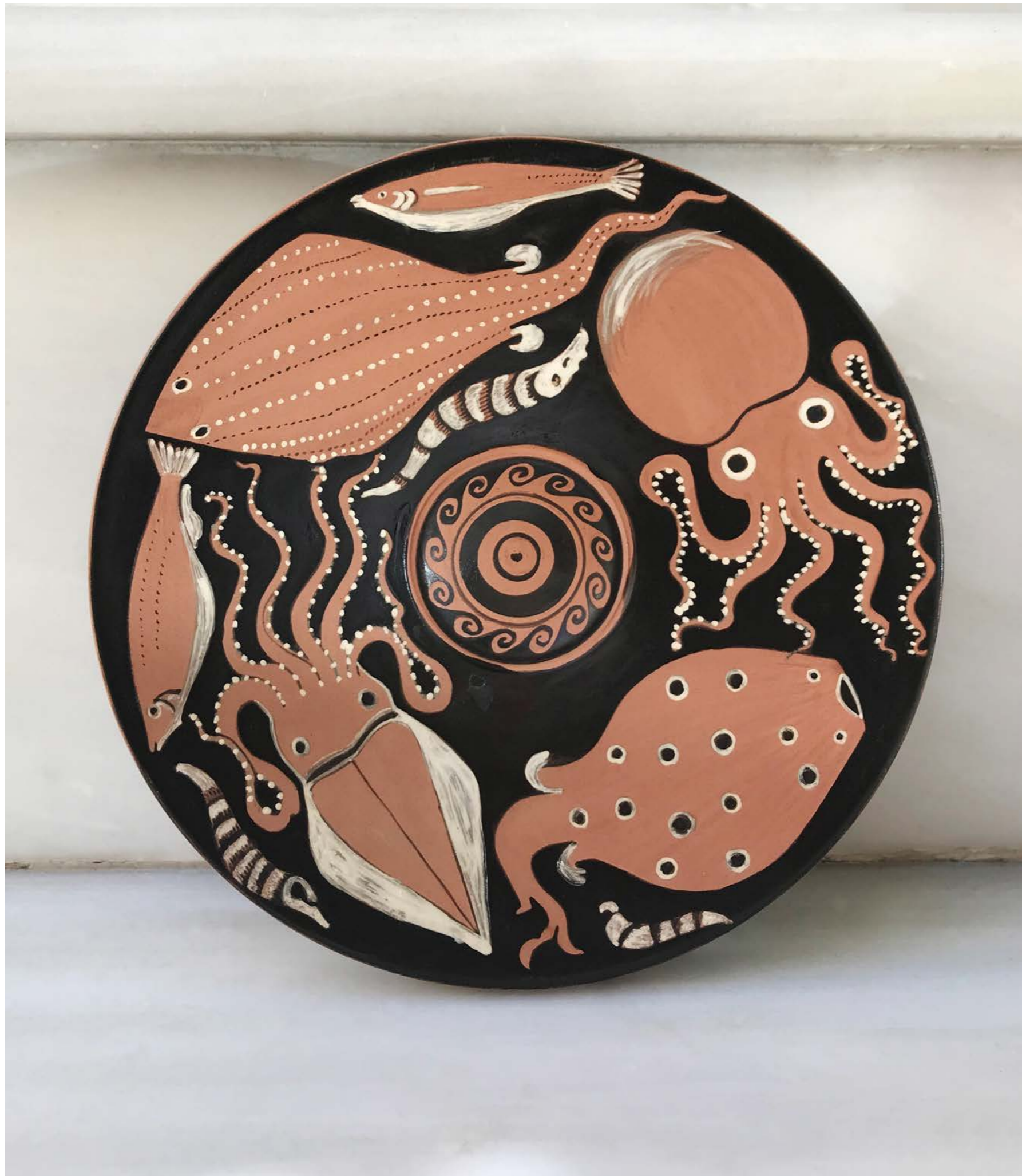
Fish Plates , 2020, ceramic with red-figure painting