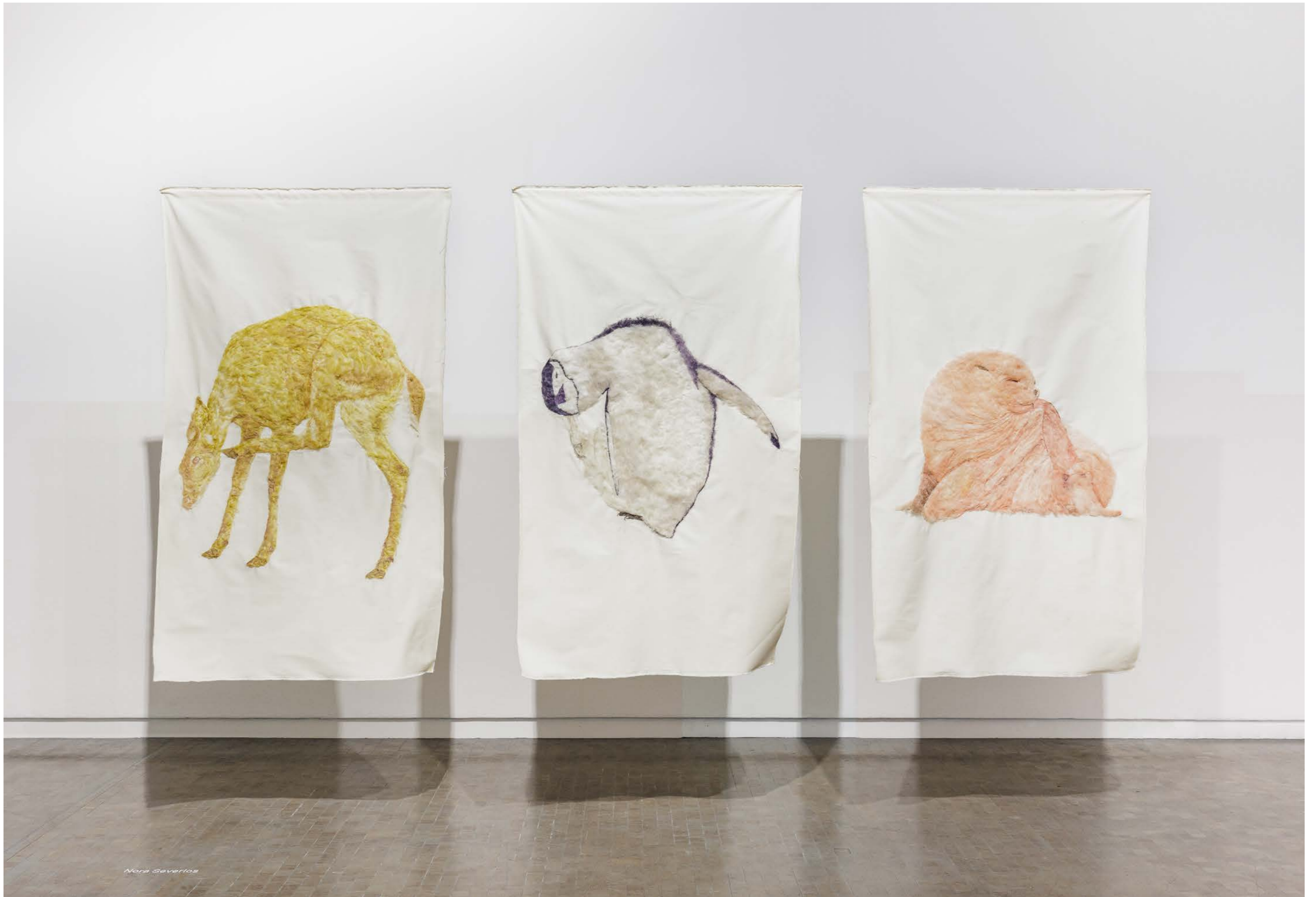
Itchy & Scratchy , 2022, 4 Paintings on nettle cloth, Exhibition view: Kunsthalle Vienna 2022