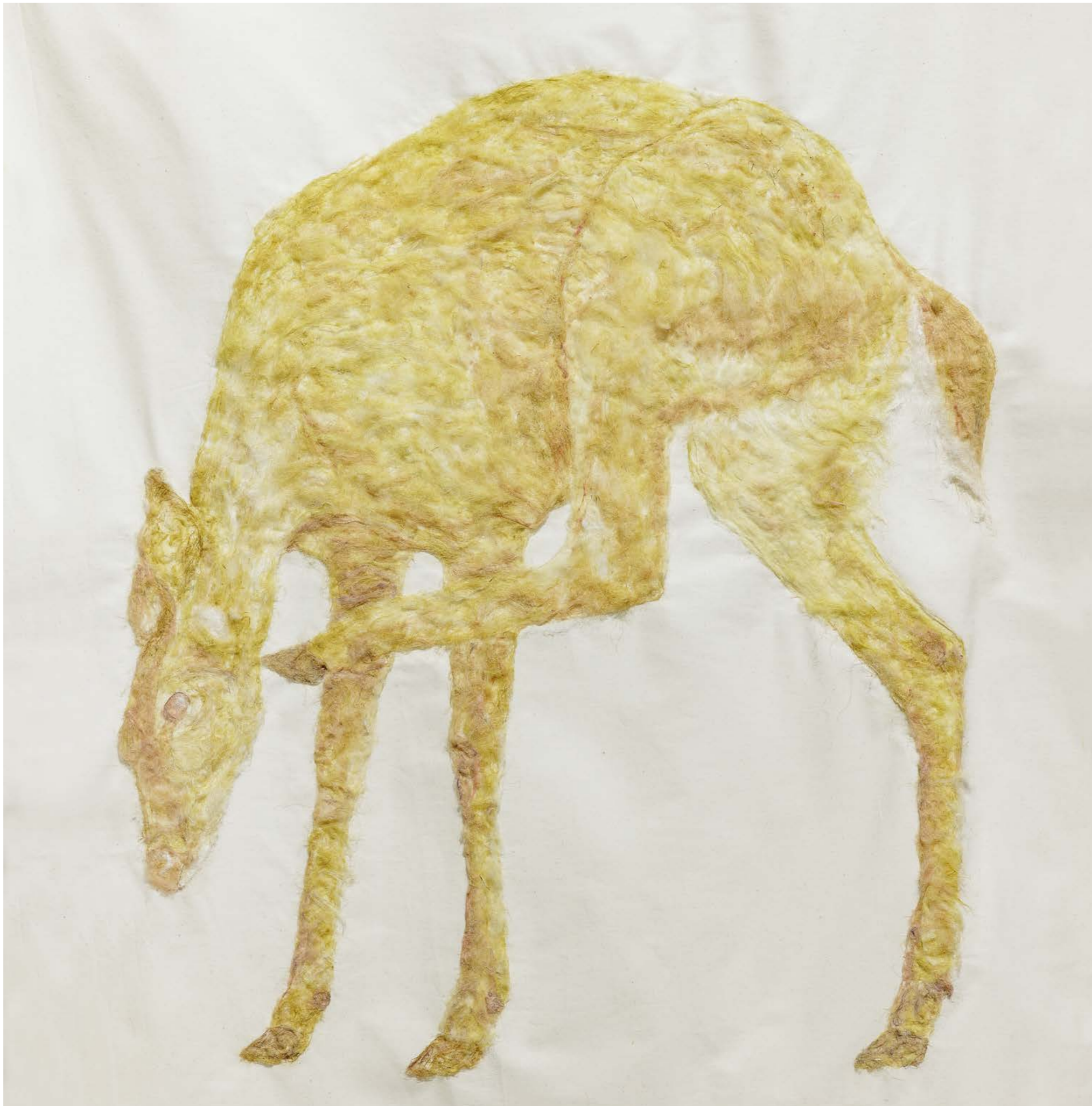
Itchy & Scratchy , 2022, 4 Paintings on nettle cloth (Detail deer), Exhibition view: Kunsthalle Vienna 2022