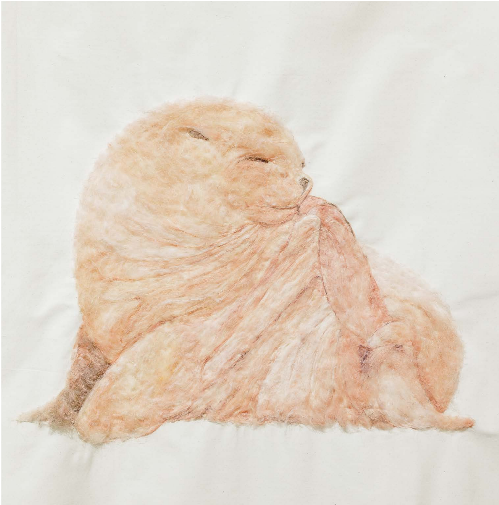
Itchy & Scratchy , 2022, 4 Paintings on nettle cloth (Detail seal), Exhibition view: Kunsthalle Vienna 2022, Foto: kunstdokumentation