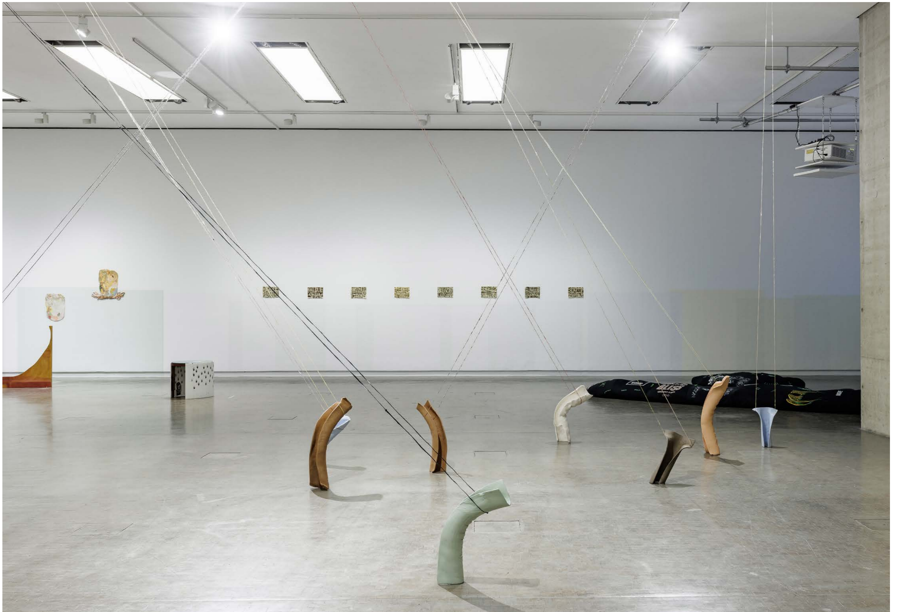
Schulen über der Erde (Airs above ground) 2022, Ceramic and Threads, (Detail of 8 Sculptures out of 9), Exhibition view: Kunsthalle Wien 2022, Photo: kunstdokumentation