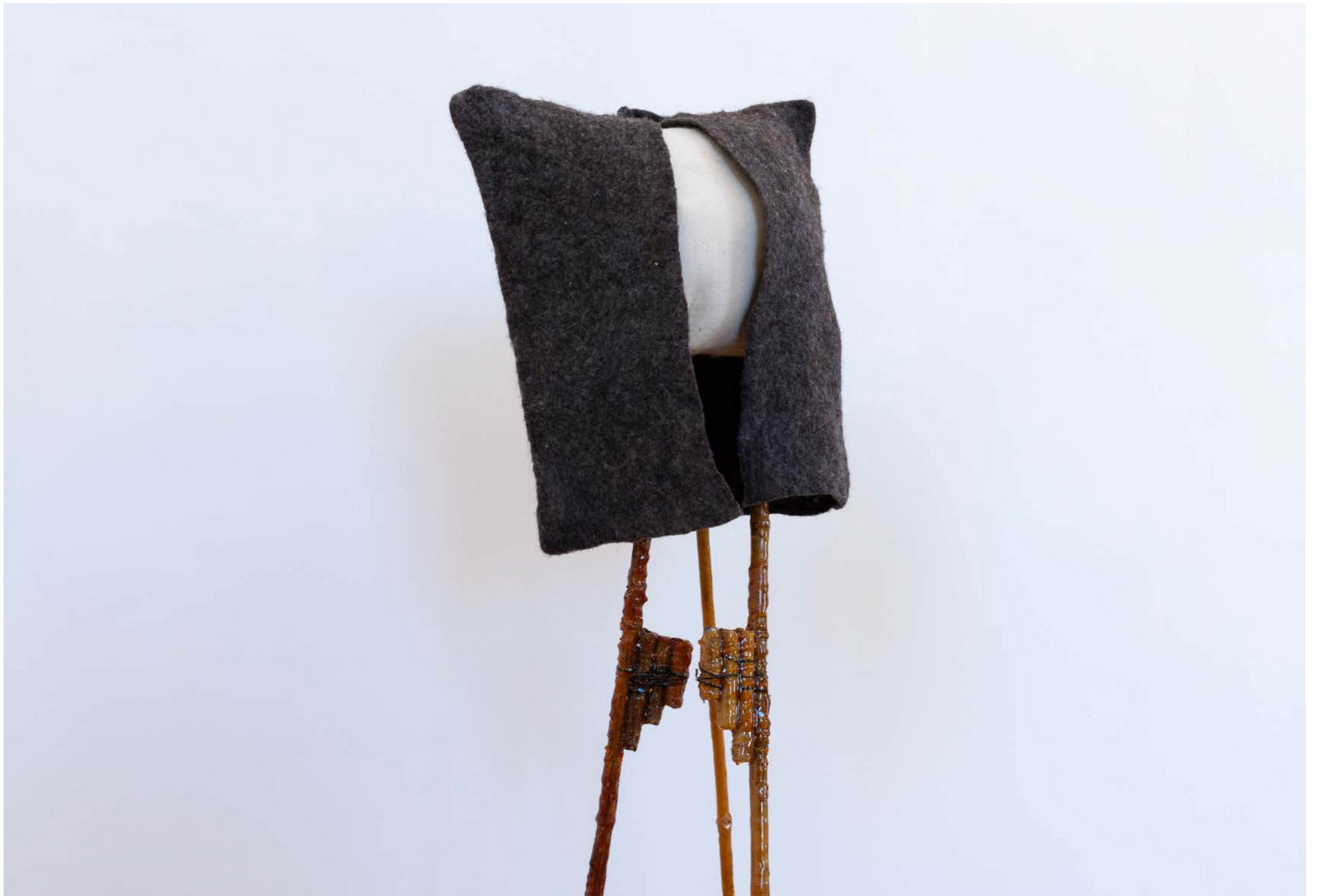
Los zancos , 2023, from the series: Keeping up with the Kurds , exhibition view: Recasted Relations, Exhibit Galerie, Academy of fine Arts Vienna, Photo: Sophie Pözl