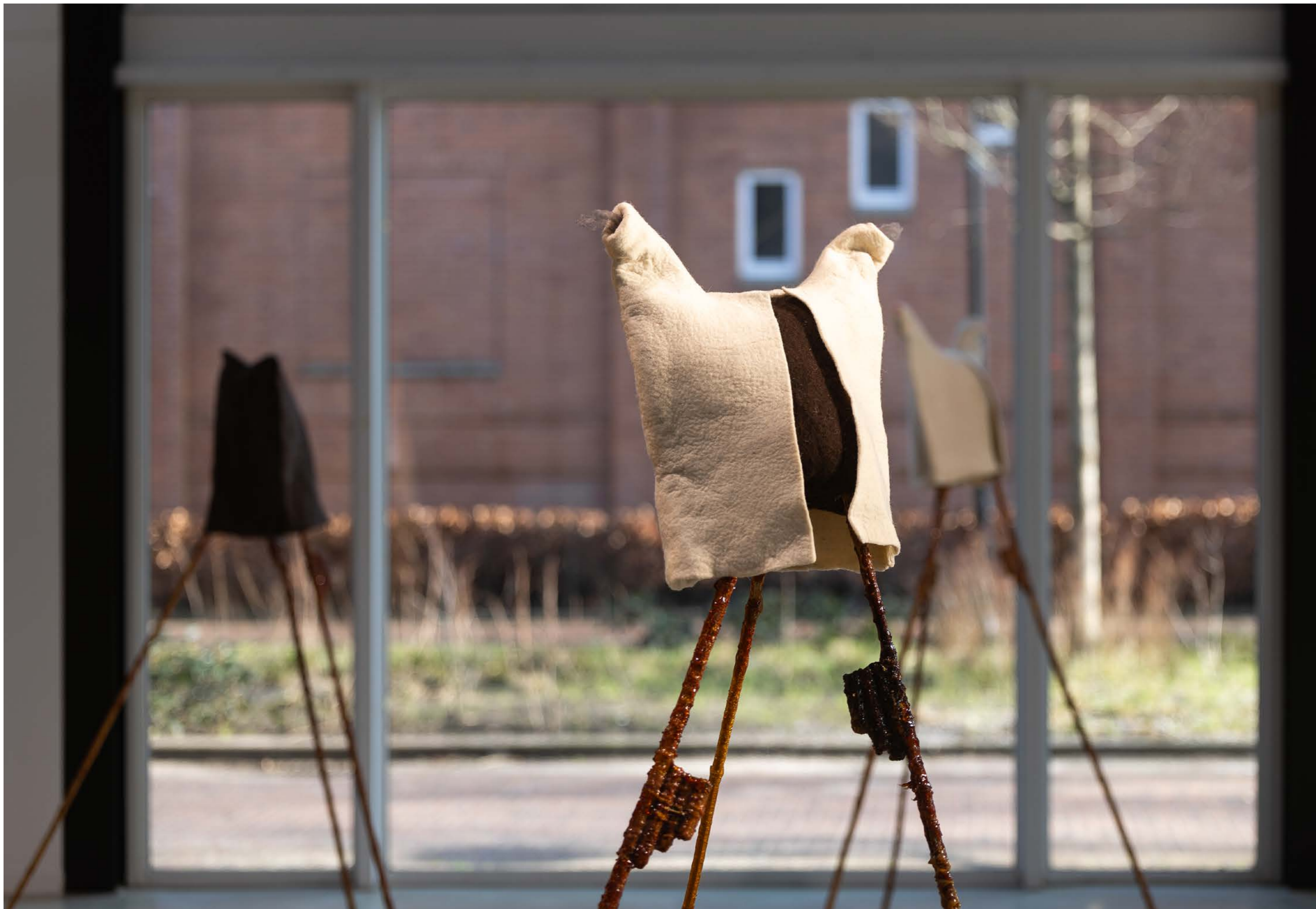
Los zancos , 2023, from the series: Keeping up with the Kurds , exhibition view: The one straw revolution curated by iLiana Fokianaki, Framer Framed, Amsterdam 2024.