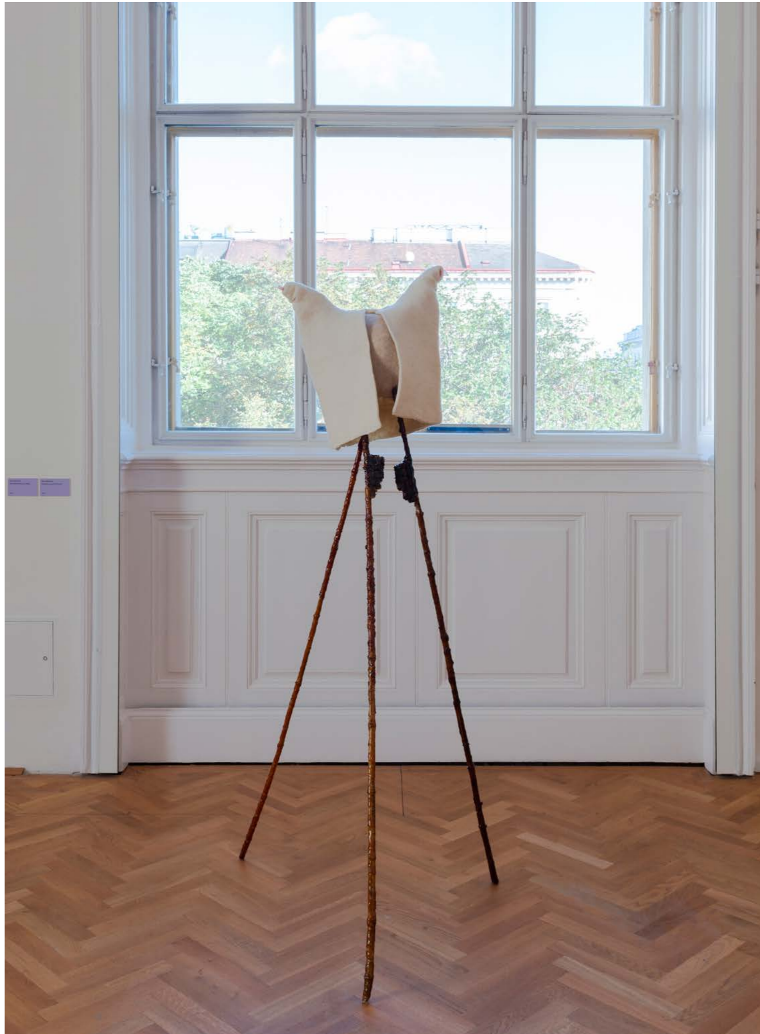
Los zancos , 2023, from the series: Keeping up with the Kurds , exhibition view: Recasted Relations , Exhibit Galerie, Academy of fine Arts Vienna, Photo: Sophie Pözl