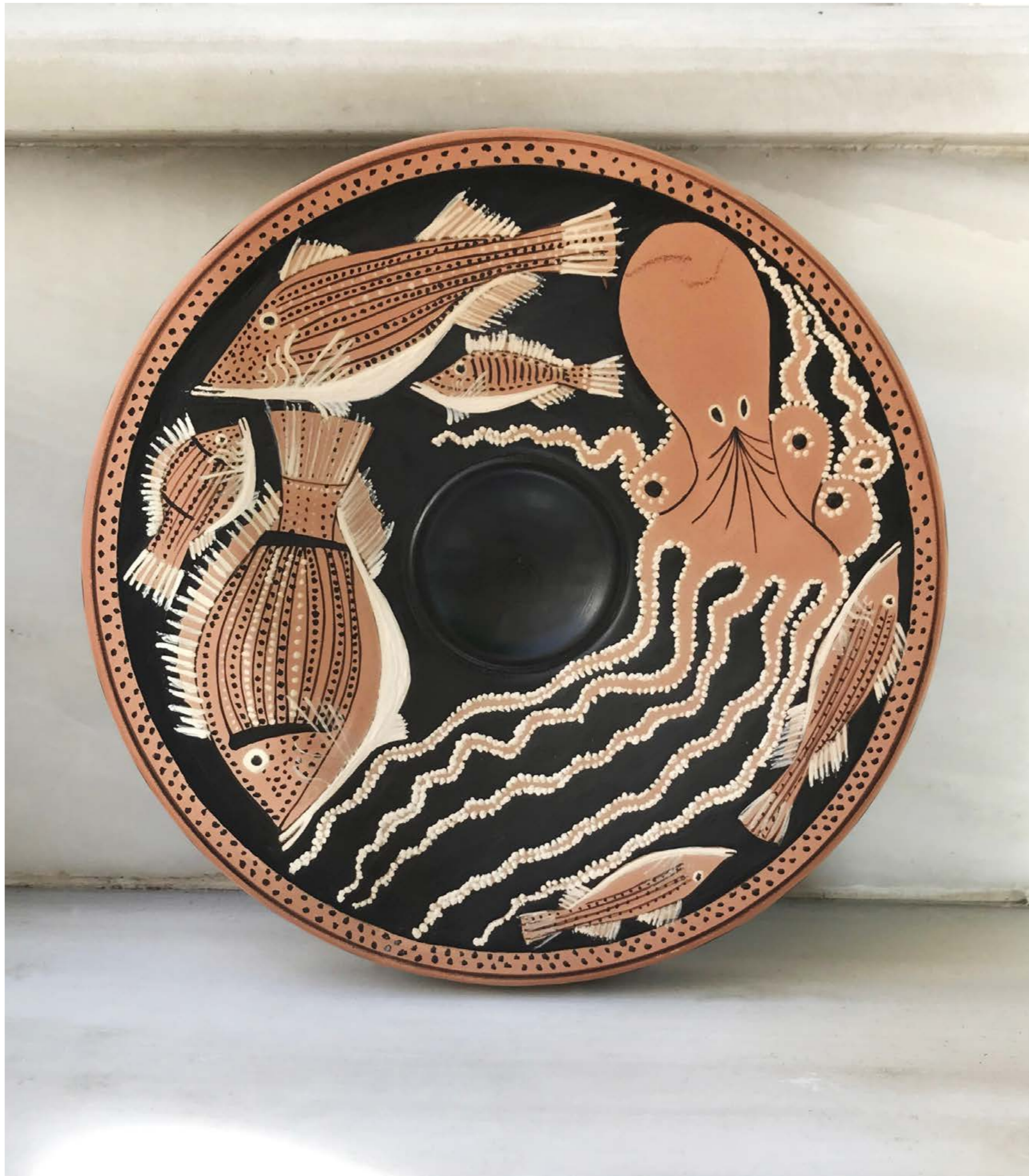
Fish Plates , 2020, ceramic with red-figure painting, Foto: Nora Severios