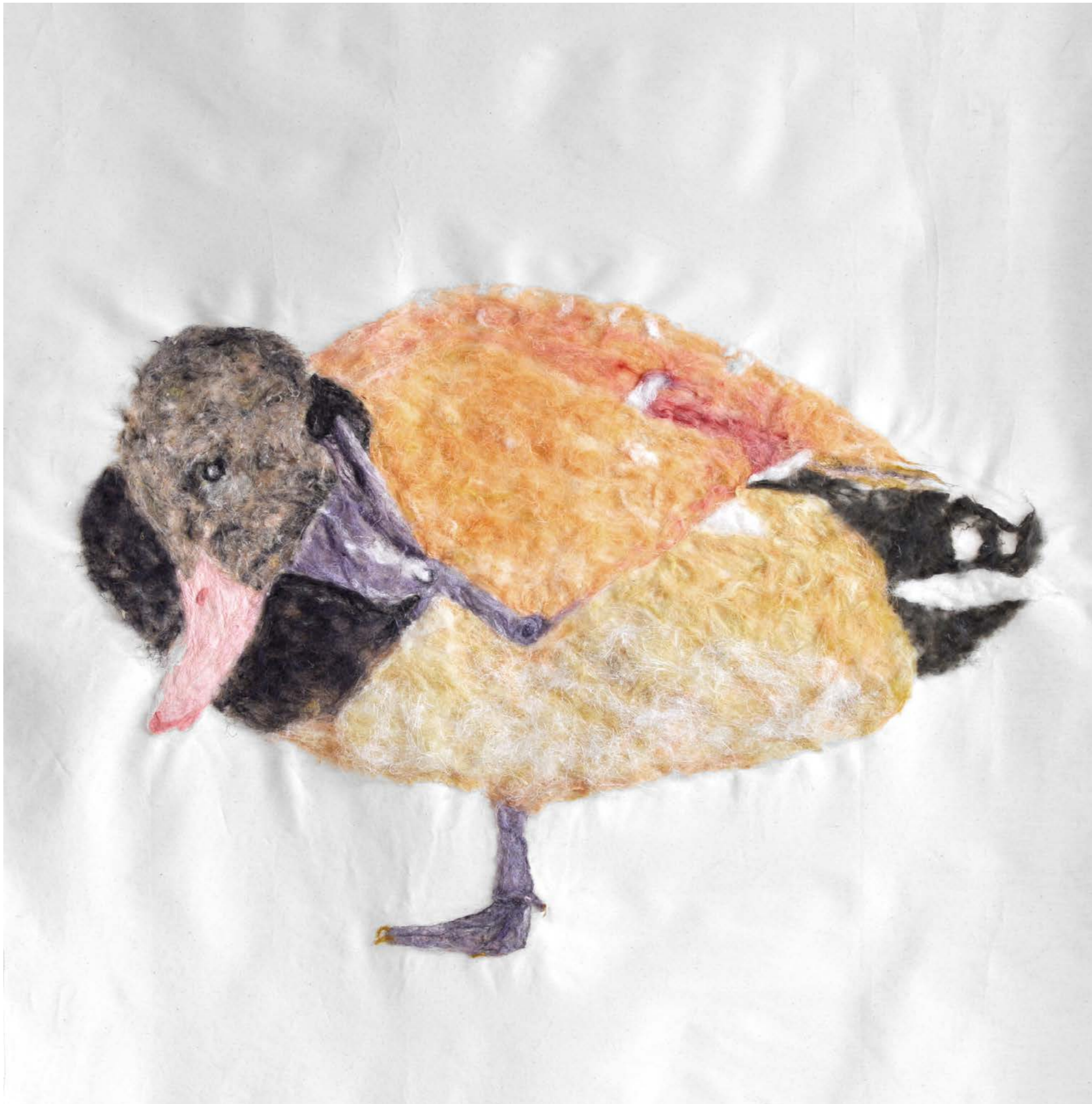
Itchy & Scratchy , 2022, 4 Paintings on nettle cloth (Detail duck), Exhibition view: Kunsthalle Vienna 2022, Foto: kunstdokumentation