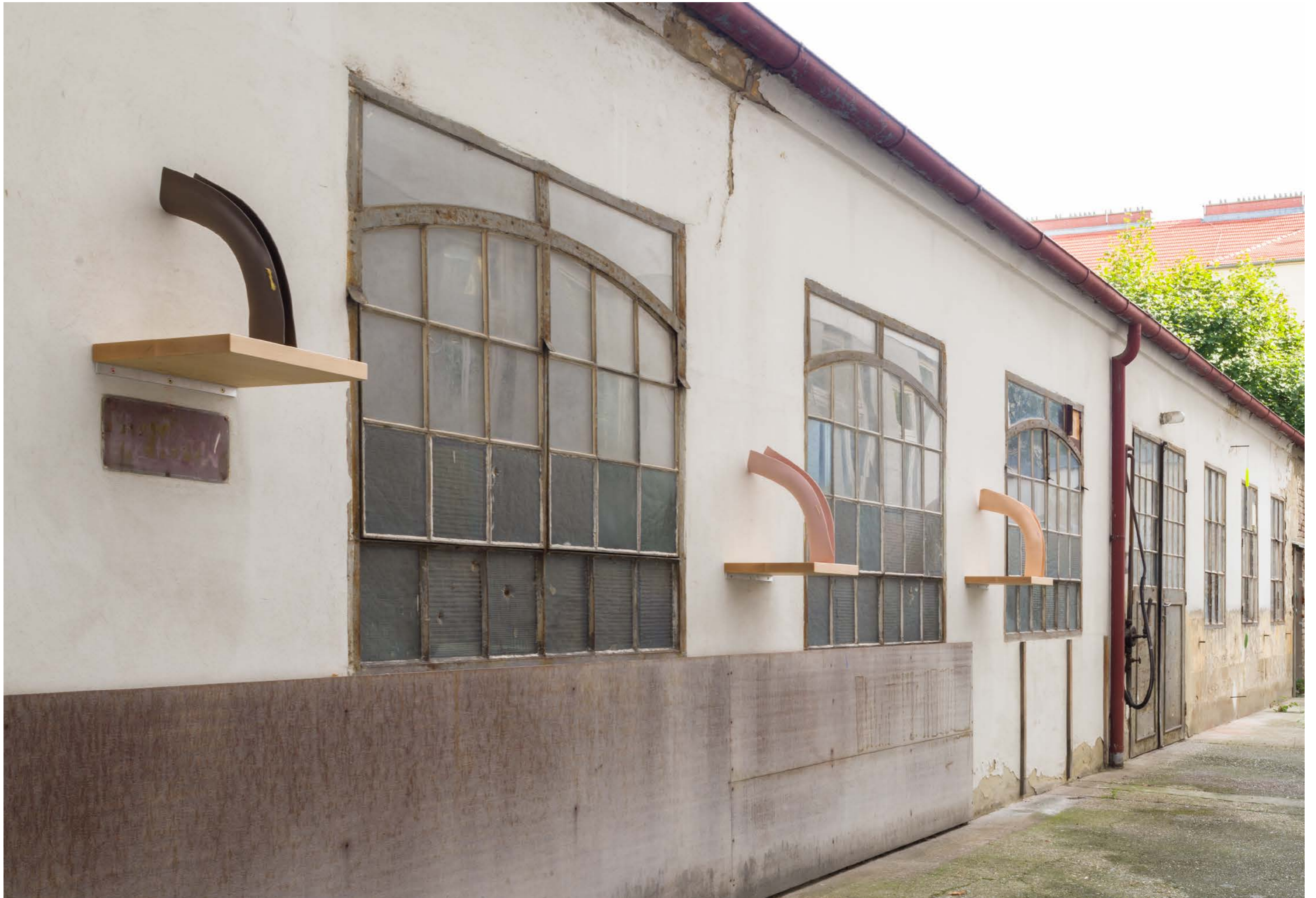
Schulen über der Erde (Airs above ground) , 2020, 3 Ceramic sculptures, Exhibitonview: Heimspiel, Wien