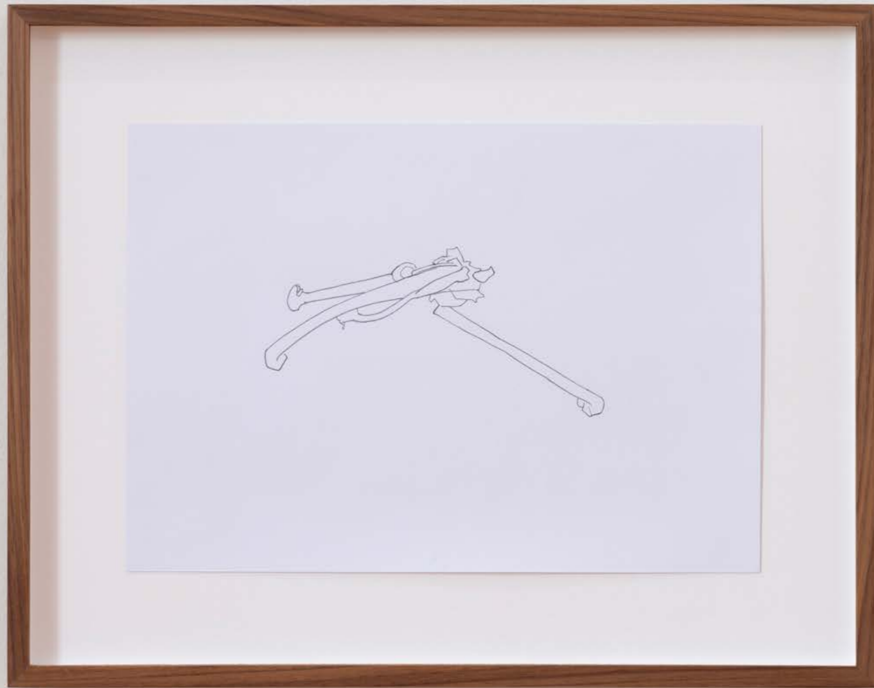
Samtfußrübling und Salbei , 2023, Exhibition view: Exhibit Galerie, Academy of fine Arts Vienna